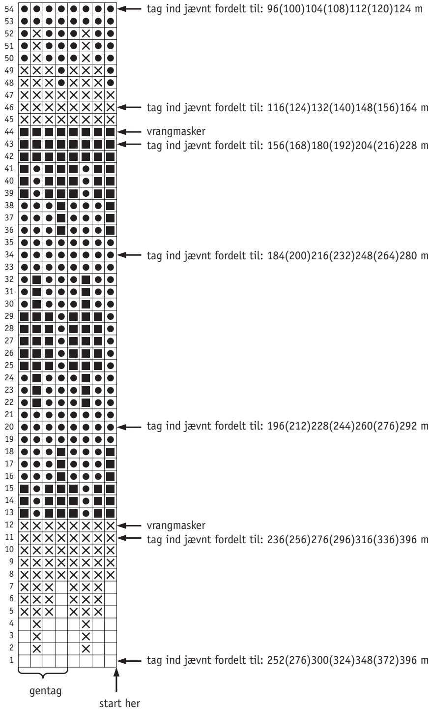
DIAGRAM 1 – Bærestykke