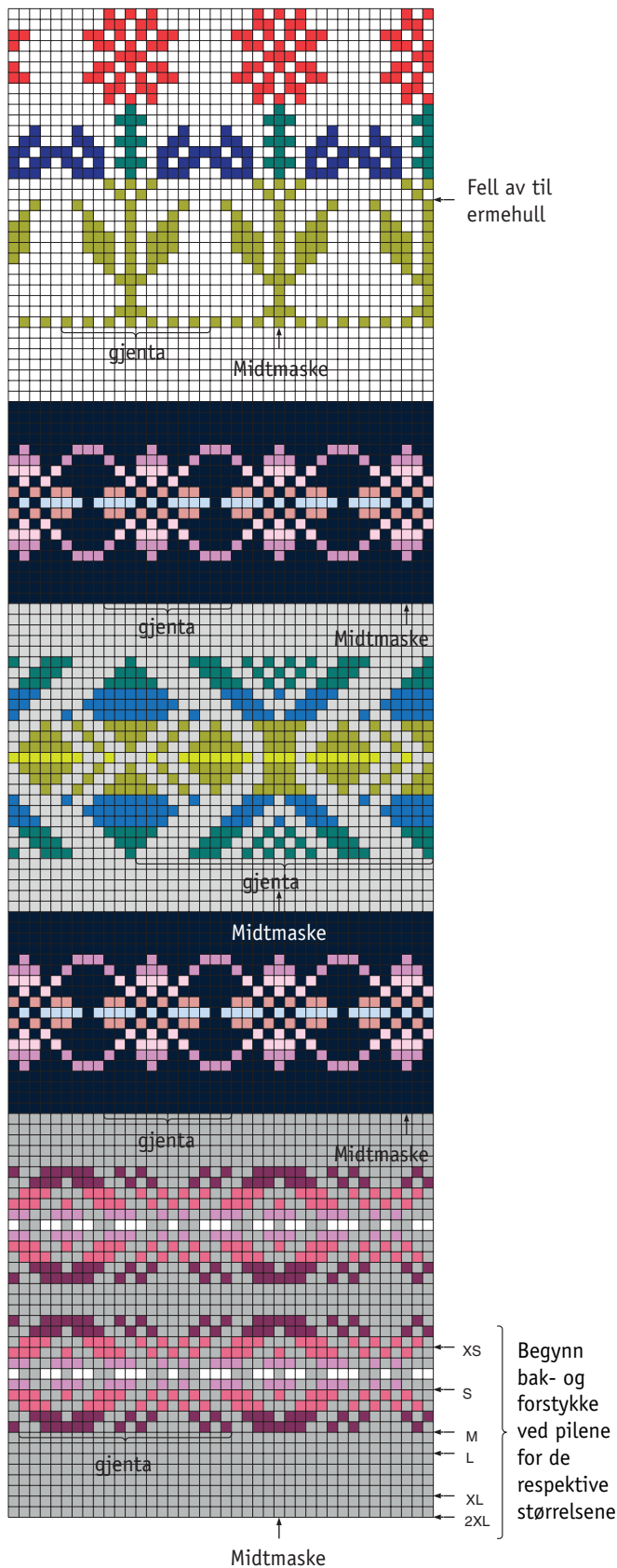
DIAGRAM 1 – bak- og forstykke

Tell ut fra midtmasken, hvor i diagrammet den aktuelle størrelsen begynner