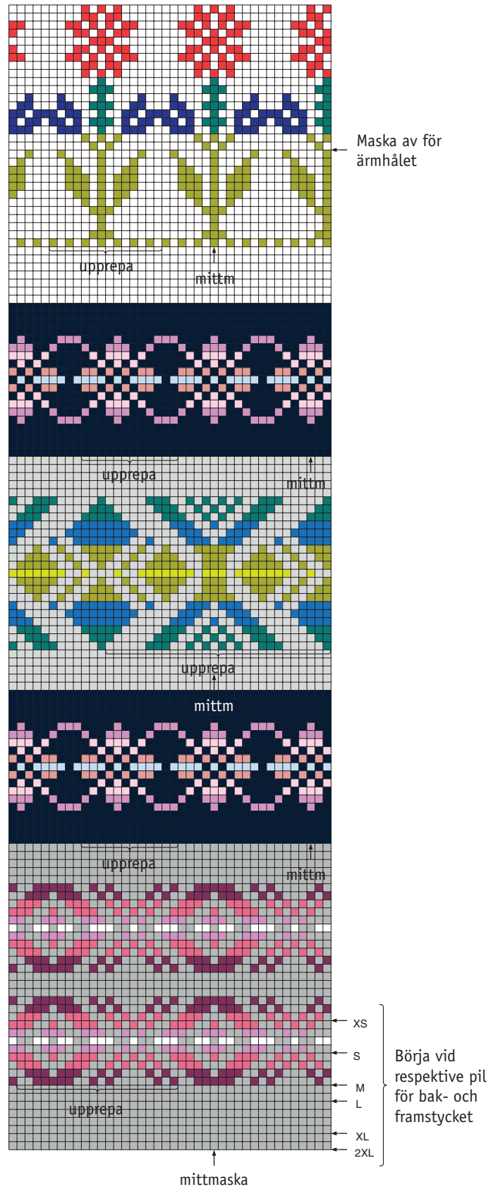
DIAGRAM 1 – bak- och framstycke

Sy ihop ärmarna, använd kantm till sömsån. Sy i ärmarna. Sy i knappar.