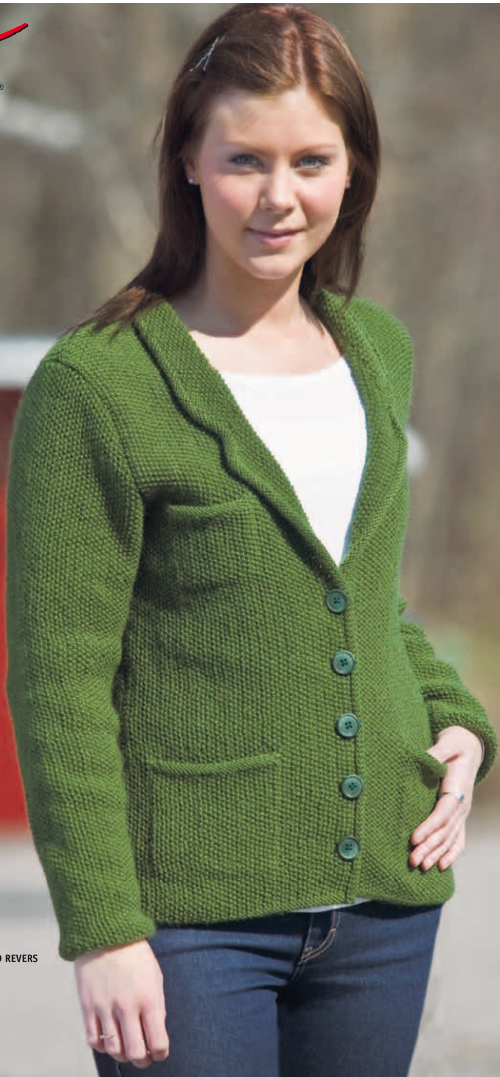
SAGA PERLESTRIKKET JAKKE MED REVERS STØRRELSE: XS-XXL