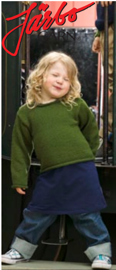
SAGA BARNTRÖJA MED RULLKANTER STORLEKAR: 92 - 158 cl